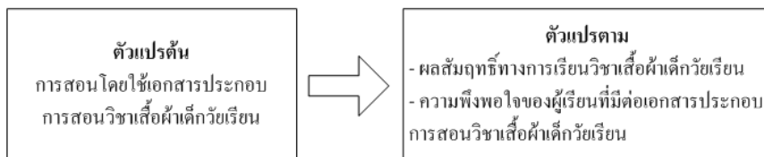
ภาพที่ 1 กรอบแนวคิดของการวิจัย

การวิจัยในครั้งนี้ ผู้วิจัยได้ศึกษาเอกสารและงานวิจัยที่เกี่ยวข้อง เพื่อกำหนดกรอบแนวคิดของการวิจัย โดยตัวแปรต้น คือ การสอนโดยใช้เอกสารประกอบการสอนวิชาเสื้อผ้าเด็กวัยเรียน ตัวแปรตามคือ ผลสัมฤทธิ์ทางการเรียนวิชาเสื้อผ้าเด็กวัยเรียน และความพึงพอใจของผู้เรียนที่มีต่อเอกสารประกอบการสอนวิชาเสื้อผ้าเด็กวัยเรียน ซึ่งสามารถแสดงถึงความสัมพันธ์ของตัวแปรต่างๆ ดังภาพที่ 1